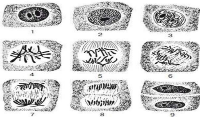
Схема митоза в клетках корешка лука : 1- интерфаза; 2,3 - профаза; 4 - метафаза; 5,6 - анафаза; 7,8 - телофаза; 9 - образование двух клеток